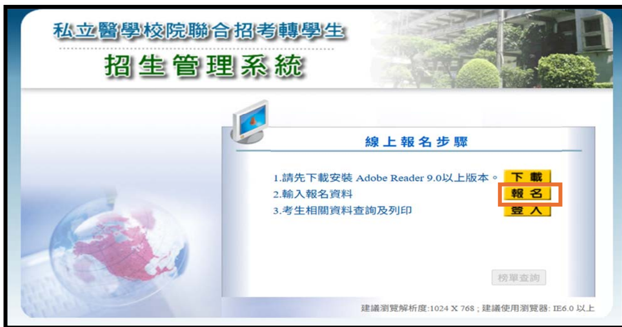
圖 1. 進入到網路報名系統。