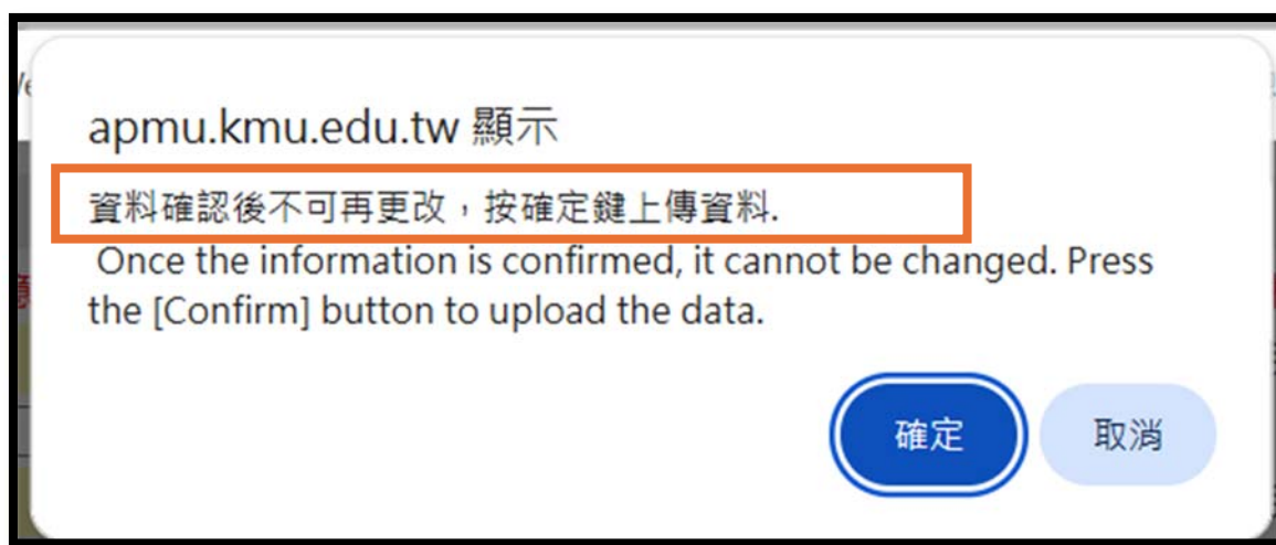
圖 6. 彈跳出小視窗提醒是否【確定】。

說明：完成後，請務必按【確認】。若有顯示訊息（如格式不符或必填欄位未填），即表示存檔失敗！請務必依訊息說明填妥或重傳大頭照後，再按【確認】。